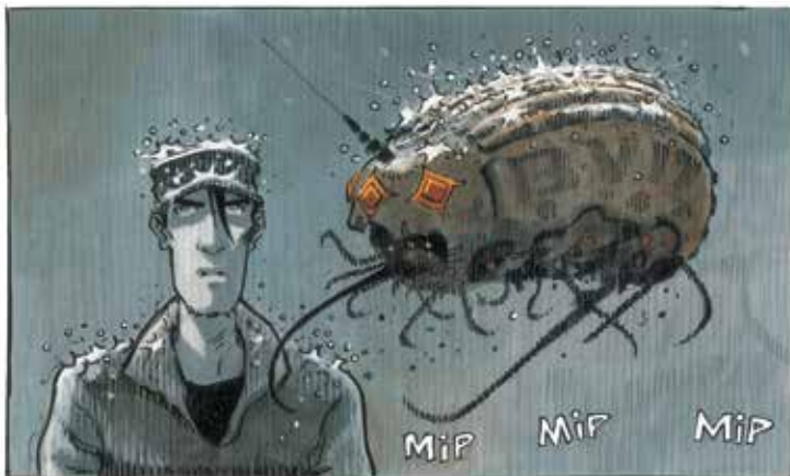
Caleb maakt kennis met een Varosash (uit ORBITAL 4: RAVAGES).

Zijn jullie niet de LARGO WINCH van de sciencefiction? Ook hij is een naïeve, neutrale held die de wereld redt van geopolitieke