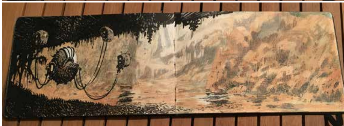
Fragmenten uit de schetsboeken van Serge Pellé.