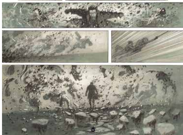
De actie klein in het midden, een stijlkenmerk van Serge Pellé (uit ORBITAL 6: VERZET ).

soms staat het geheel me niet aan en begin ik opnieuw. Zonder rancune.”