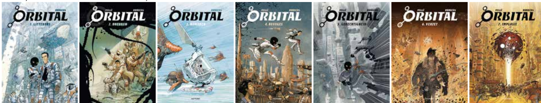
De zeven bij Microbe verschenen albums van ORBITAL. deel 8 verschijnt in 2018.