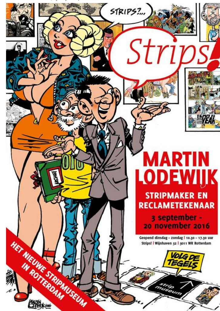
Affiche van de eerste, tijdelijke expo.

cellen exposeren van bekende Amerikaanse tekenfilmstudio's. Nee, ik zie geen concurrentie met de stripmusea in Groningen en Brussel. Wij willen het hier in Rotterdam vooral laagdrempelig houden en we zijn familiegericht. Wat niet wil zeggen dat we ons stevig willen positioneren. Het stripmuseum in Groningen is kleiner en ligt in het noorden van het land op